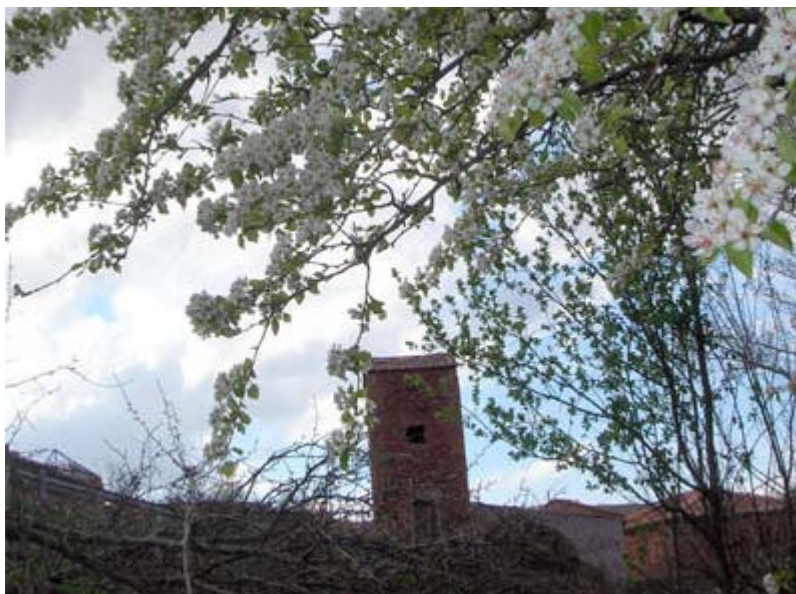
Entre floreadas ramas de almendros despunta la torre de la luz a la entrada de Cuevas de Ayllón por Semana Santa.

Hace unos meses terminaba el año 2005 y con él se cerraba el decimoquinto aniversario de la fundación de la Peña. No hubo grandes celebraciones, pero la efeméride está ahí. Esta Asociación, que ya ha cumplido sus quince primaveras, continúa adelante. ¿Por cuánto tiempo? Depende de nosotros, de todos nosotros. Veamos